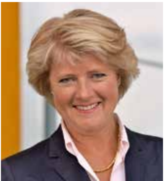
Prof. Monika Grütters MdB

Staatsministerin bei der Bundeskanzlerin